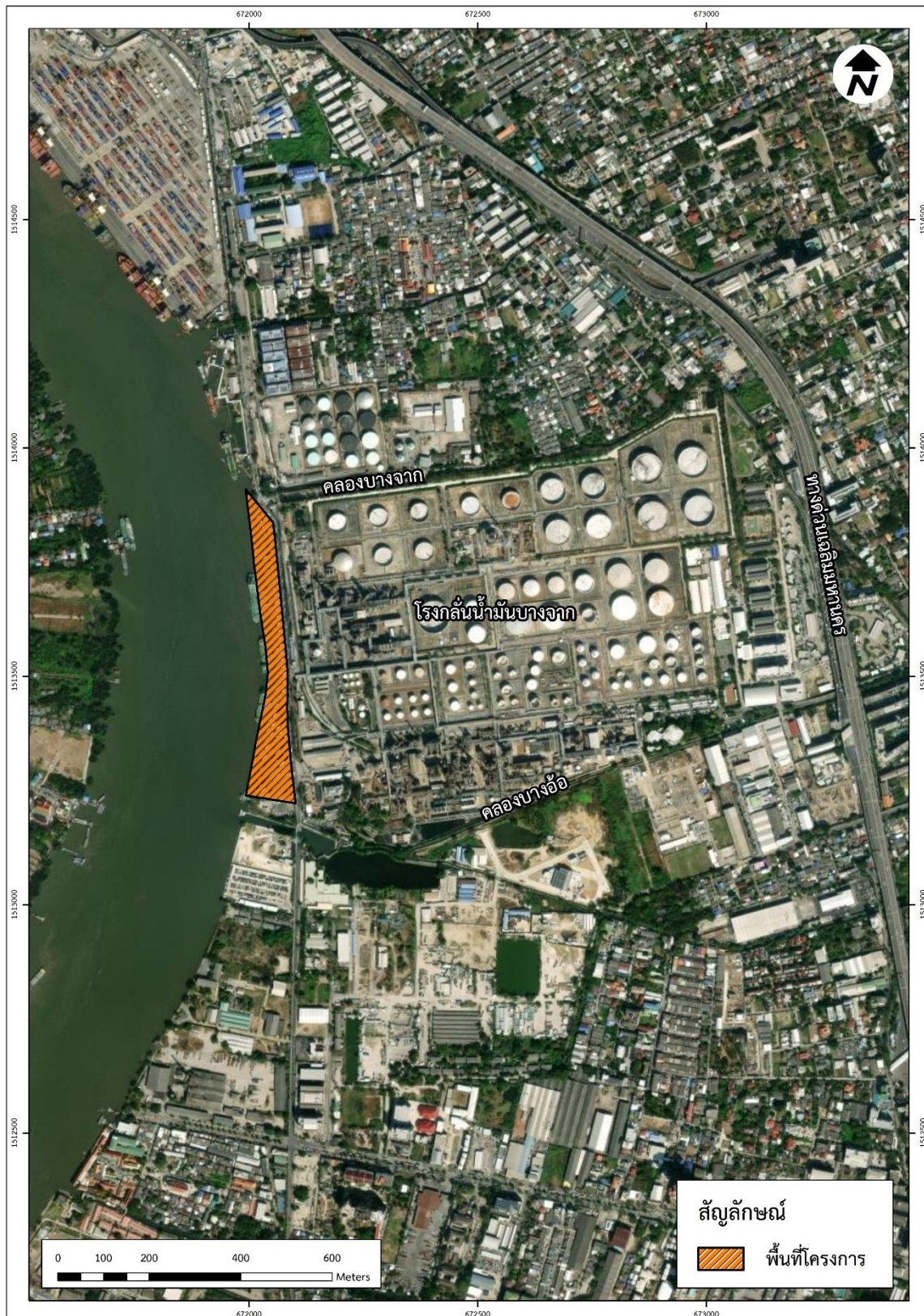
รูปที่ 1-1 ที่ตั้งโครงการท่าเทียบเรือ บริษัท บางจาก คอร์ปอเรชั่น จำกัด (มหาชน)